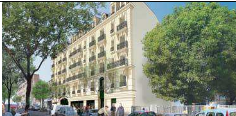
LES BALCONS DE LA GARE CONSTRUCTION DE 23 APPARTEMENTS ET D'UNE CRÈCHE 9/11 rue de Vanves Clamart 92140

Des modifications sont susceptibles d'être apportées à ce plan en fonction des nécessités techniques et administratives lors de la réalisation, pour les dimensions libres, pour la position des baies et équipements. Les surfaces indiquées sont approximatives. La surface des placards est incluse dans la surface des pièces attenantes. Les emplacements des équipements sont figurés à titre indicatif. Les retombées, soffites, faux plafonds, et les radiateurs ne figurent pas sur ce plan.