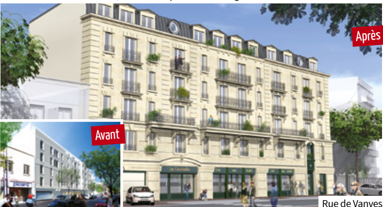
Rue de Vanves

L'architecture des immeubles en construction rue de Bièvres et rue de Vanves a été retravaillée, avec une façade mieux intégrée au bâti clamartois.