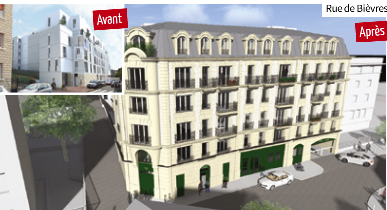
L'architecture des immeubles en construction rue de Bièvres et rue de Vanves a été retravaillée, avec une façade mieux intégrée au bâti clamartois.

Dans le neuf comme dans l'ancien, les ventes de logements donnent aux bailleurs sociaux les moyens de financer leurs projets. Rénovation du parc ancien et construction de nouveaux logements sont l'autre versant positif de ces ventes aux occupants. Rue de Bièvres, Clamart Habitat construit par exemple une nouvelle résidence de 59 logements sociaux et 89 places de stationnement, dont 39 places publiques pour le quartier. L'acquisition par d'anciens locataires permet ainsi d'augmenter le nombre de logements disponibles, grâce aux financements dégagés par les ventes. Pour les acquéreurs, ces ventes comportent également des clauses sécurisantes, comme l'obligation pour le bailleur de remettre en bon état le bâtiment avant la vente ou la garantie de rachat en cas de difficultés financières.